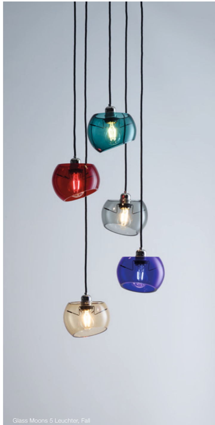
Glass Moons 5 Leuchter, Fall