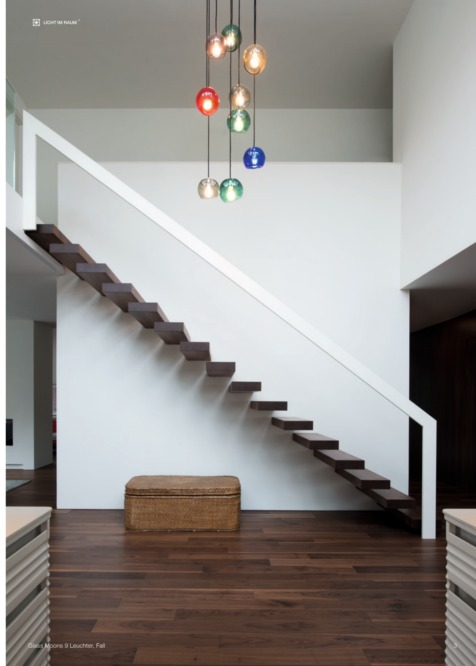
Glass Moons 9 Leuchter, Fall