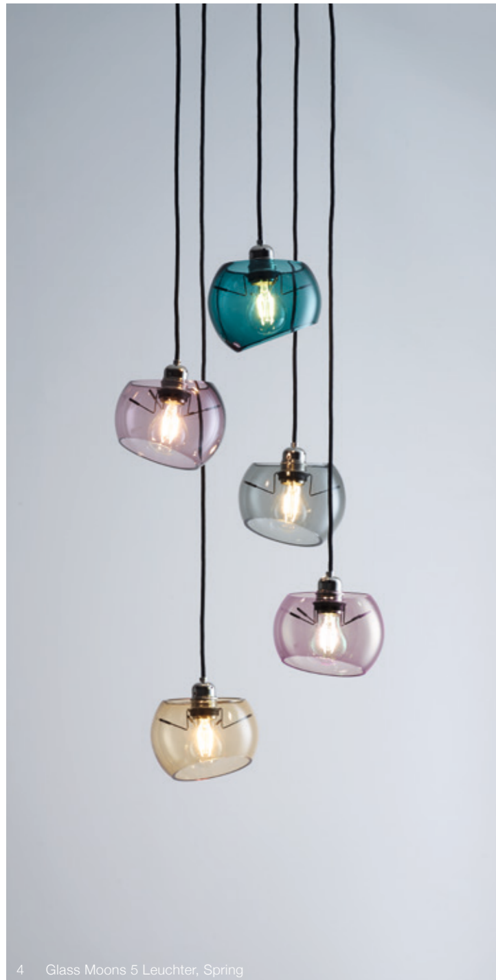
4 Glass Moons 5 Leuchter, Spring

White Moons is one masterstroke of German design. The repeatedly rewarded luminaire family has been further expanded by one elegant pendant luminaire. With its handcrafted porcelain spheres – produced by Fürstenberg – it imparts pure elegance and glare-free light, for example above the dining table. Like Glass Moons, the luminaire White Moons is available in different sizes (3, 5, 7 or 9 spheres) and can be equipped with simple light bulbs – it is best to use LED – and is with that suitable for all technical innovations and improvements.