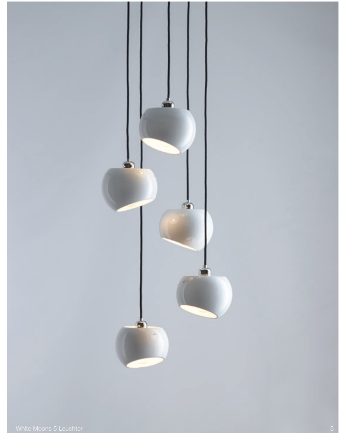
White Moons 5 Leuchter